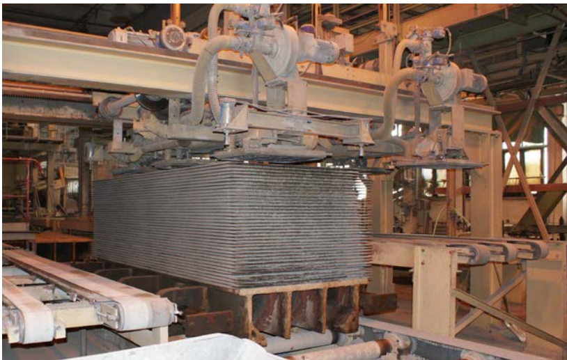
Obr. 2.: Výroba cementotřískových desek

Při tomto výrobním procesu je do míchacího zařízení přes váhy dopravena připravená dřevní hmota, kvalitní portlandský cement, podle receptury mineralizační látky a voda, jejíž množství se přizpůsobuje podle naměřené vlhkosti dřeva.