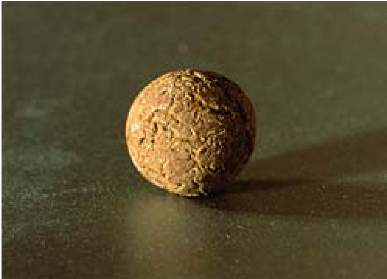
Obr. 1.: Lehčené kamenivo

Díky vynikajícím vlastnostem jílu ve využívaném ložisku a díky úrovni jejich zpracování patří tento typ lehčeného kameniva se svou sypanou hmotností 300-500 \text{ kg/m}^3 mezi nejlehčí materiály tohoto druhu na světě.